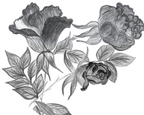
Vortrag 1 unserer Reihe

Weitere Veranstaltungen werden rechtzeitig im Info bekannt gegeben.